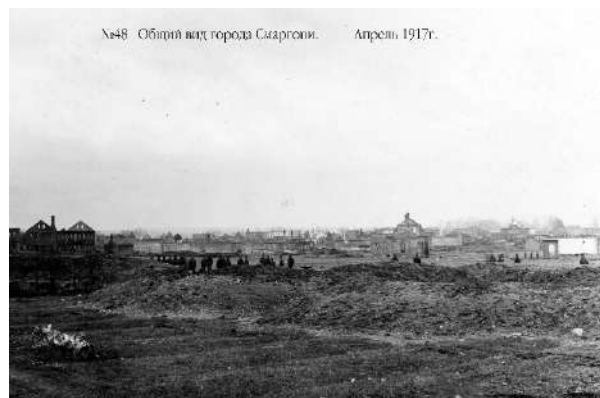
№48 Общий вид города Сморгони. Апрель 1917г.

Несмотря на то, что про 16 сентября 1917 года в Сморгони мало сведений, остался «Юношеский роман» В. Катаева. Ниже привожу отрывки из данного произведения. Я полагаю, что такой же увидел в 1917 года Сморгонь и герой нашего повествования Тимофей Максимович Виноградов.