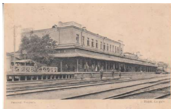
Станция Рязск, при которой находился госпиталь [7]