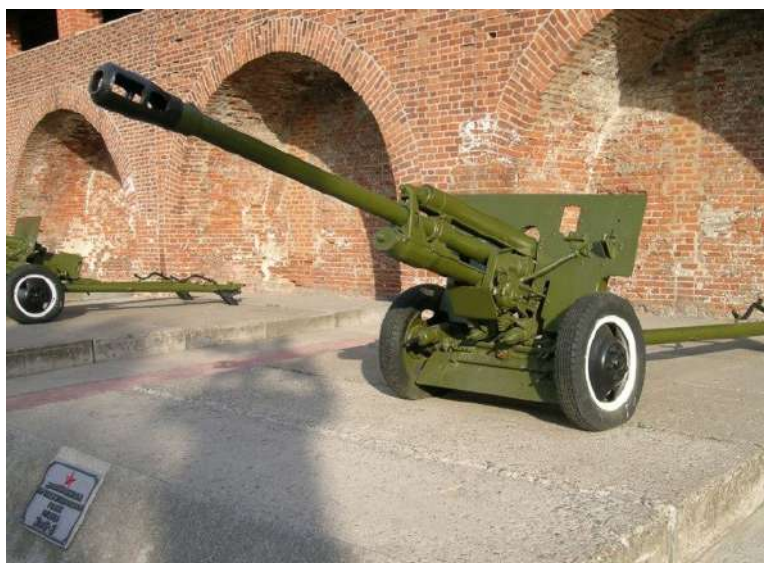
76-мм дивизионная пушка

Помимо двух медалей «За отвагу», был награждён медалью «За победу над Германией в Великой Отечественной войне 1941–1945 гг.» и юбилейными медалями.