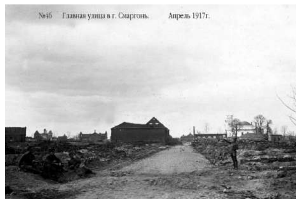
№46 Главная улица в г. Сморгонь. Апрель 1917г.

дошла до Сморгони и здесь остановилась, прочно остановив наступление немцев. Здесь пролегает линия нашего Западного фронта, а мы просто называем это «у нас под Сморгонью» [5].